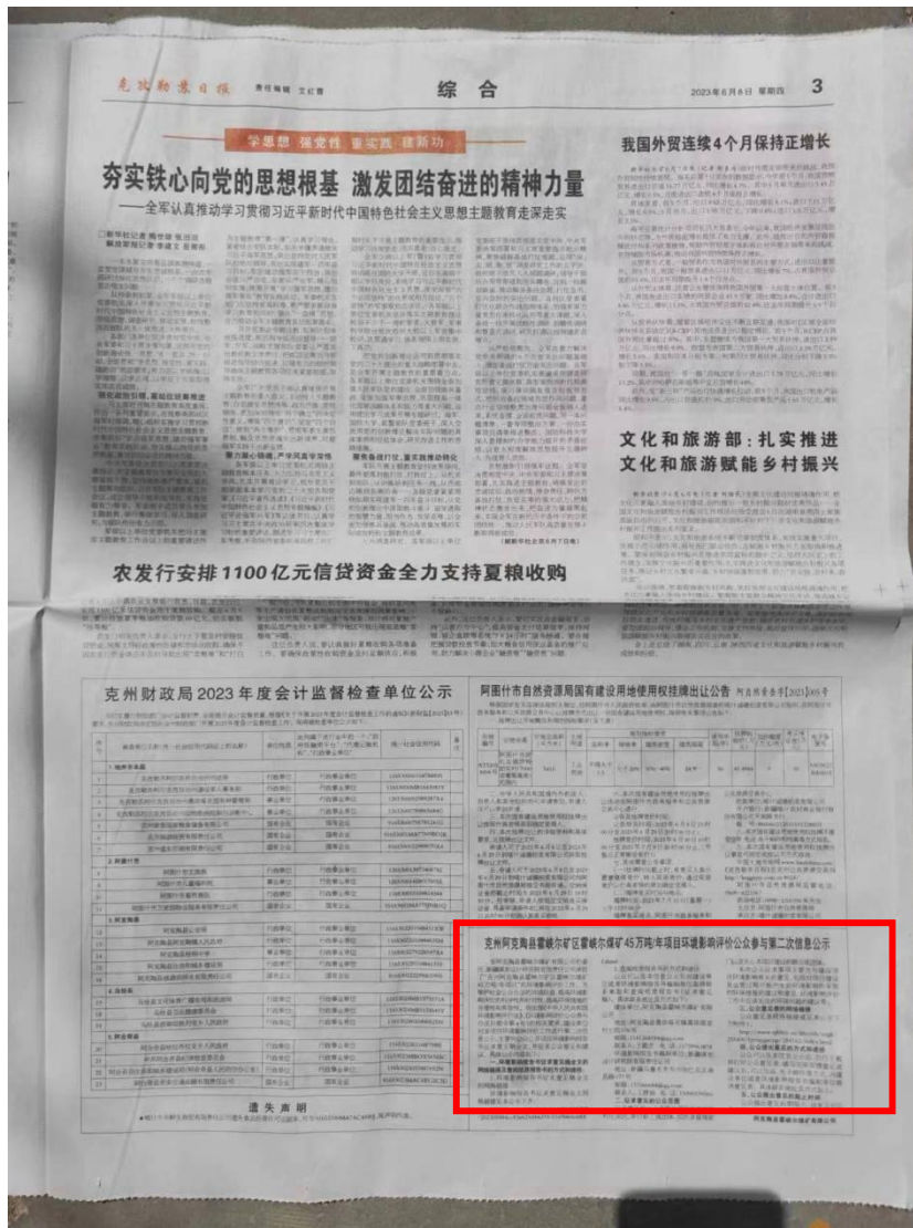
图 3.2-3 征求意见稿阶段第二次报纸公示截图（2023 年 6 月 8 日）