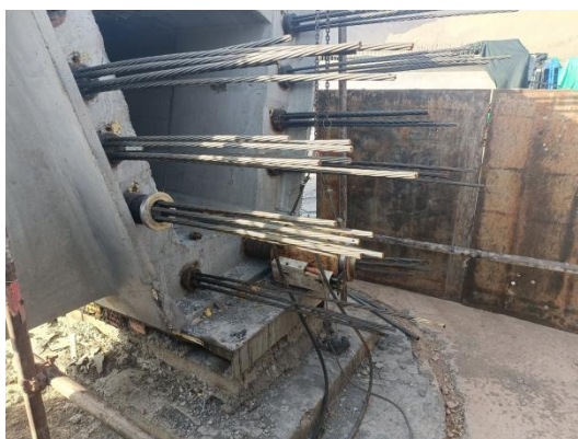
场涉事箱梁左前方图